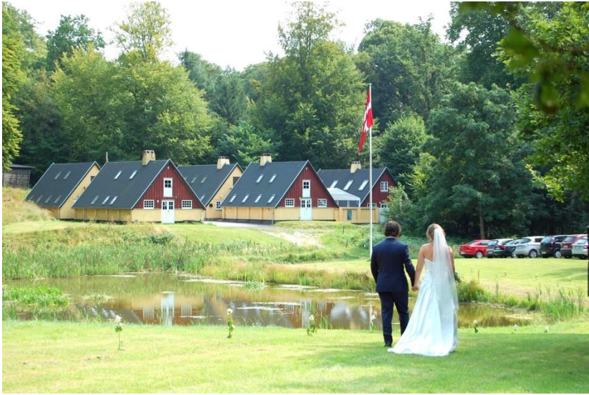
Bryllup på Høje Sandbjerg