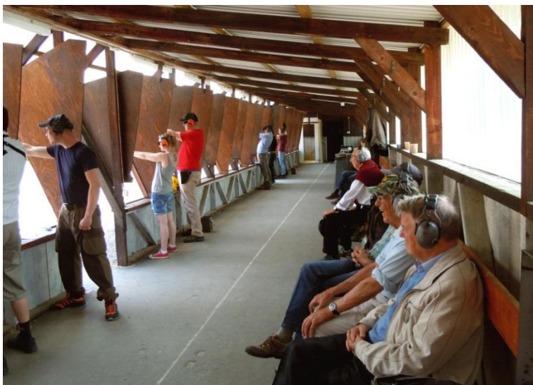
Pistolskydning og markering