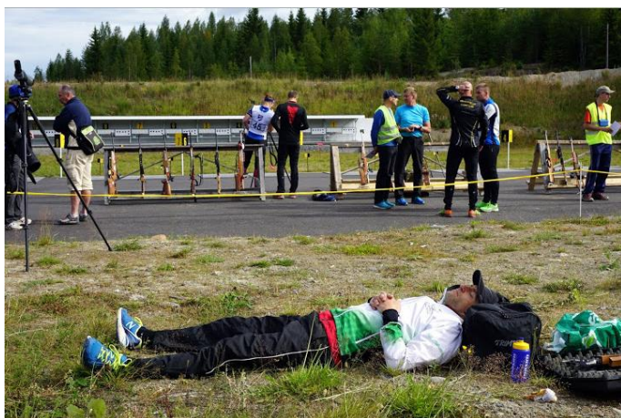
Nicolais opladning til konkurrencerne

Den medbragte GPS førte os sikkert frem til vort underbringelsessted, hvor arrangøren på snedig vis havde gemt vores nøgler til sovesalen under en uskyldigt udseende bænk ude foran bygningen.