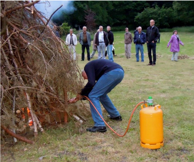
Sandbjerginspektøren tænder bålet