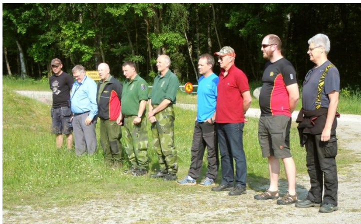
Riffelholdene ved præsentation og flaghejsning