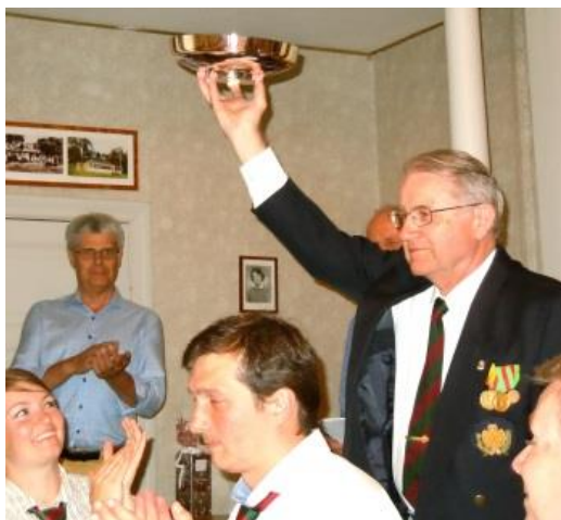
Skydning Lagledarne for de vindende hold: