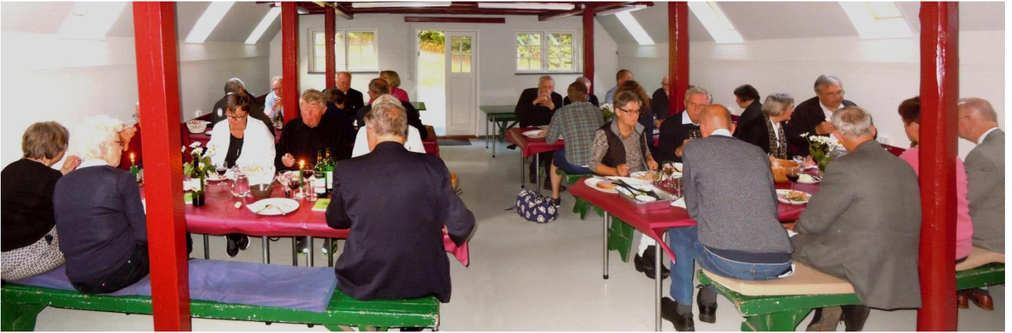
Middagen i mandskabsmessen