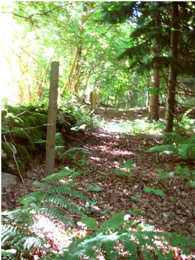
Stiforløb mod vest nord for skellet

Forslaget om en offentlig sti slyngende sig over grunden fra sydøst lågen, langs engen, over håndboldbanen og op langs stendiget på vor side til nordvest lågen er ændret til en offentlig trampesti fra Toppen gennem nordøst lågen, langs stendiget, så over diget og fortsættende det meste af vejen nord for stendiget på vore nordlige naboers grunde. Stiføringen komme således til at følge det kompromisforslag, som foreningen har kæmpet for, nu da der skulle være en sti. Det er endvidere slået fast, at cykling ikke er tilladt på stien.