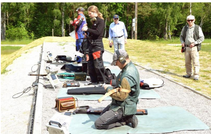
200 m standpladsen