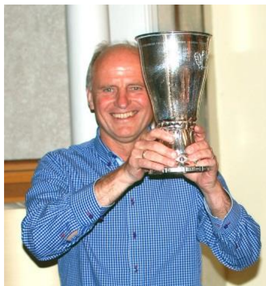
holder pokalerne frem